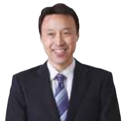
●塾長プロフィール 1969年生まれ、須賀川育ち。 自身の浪人時代に培った 「復習の徹底で成績は必ず伸びる」が信念。 現在も中3受験生の数学・理科を熱血指導。

中3受験生の皆さん、Ⅱ期受験まで2ヵ月を切りました。焦りと不安で「やる気が起きない」「何を今やるべきなのか分からない」など、精神的に強いプレッシャーを感じていらっしゃる生徒さんが多いと察しております。私共はそんな生徒さん達のために、入試本番への不安を軽減したいと考え、下記の「福島県プレ入試&熱血解説」を開催致します。成績を伸ばす一番の近道は弱点を知り、克服し、正しい知識を定着させることです。ジーニアスは最後の最後まで受験生に寄り添ってお力になって参ります。志望校合格を一緒に実現していきましょう。