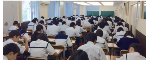
西川本部校 中3新教研テスト