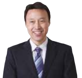
●塾長プロフィール 1969年生まれ、須賀川育ち。 自身の浪人時代に培った 「復習の徹底で成績は必ず伸びる」が信念。 現在も中3受験生の数学・理科を熱血指導。

中3受験生の皆さん、Ⅱ期受験まで2ヵ月を切りました。焦りと不安で「やる気が起きない」「何を今やるべきなのか分からない」など、精神的に強いプレッシャーを感じていらっしゃる生徒さんが多いと察しております。私共はそんな生徒さん達のために、入試本番への不安を軽減したいと考え、下記の「Ⅱ期選抜プレテスト&熱血解説」を開催致します。成績を伸ばす一番の近道は弱点を知り、克服し、正しい知識を定着させることです。ジーニアスは最後の最後まで受験生に寄り添ってお力になって参ります。志望校合格を一緒に実現していきましょう。